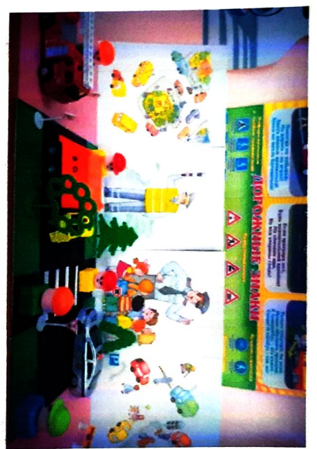
фото на странице: 2