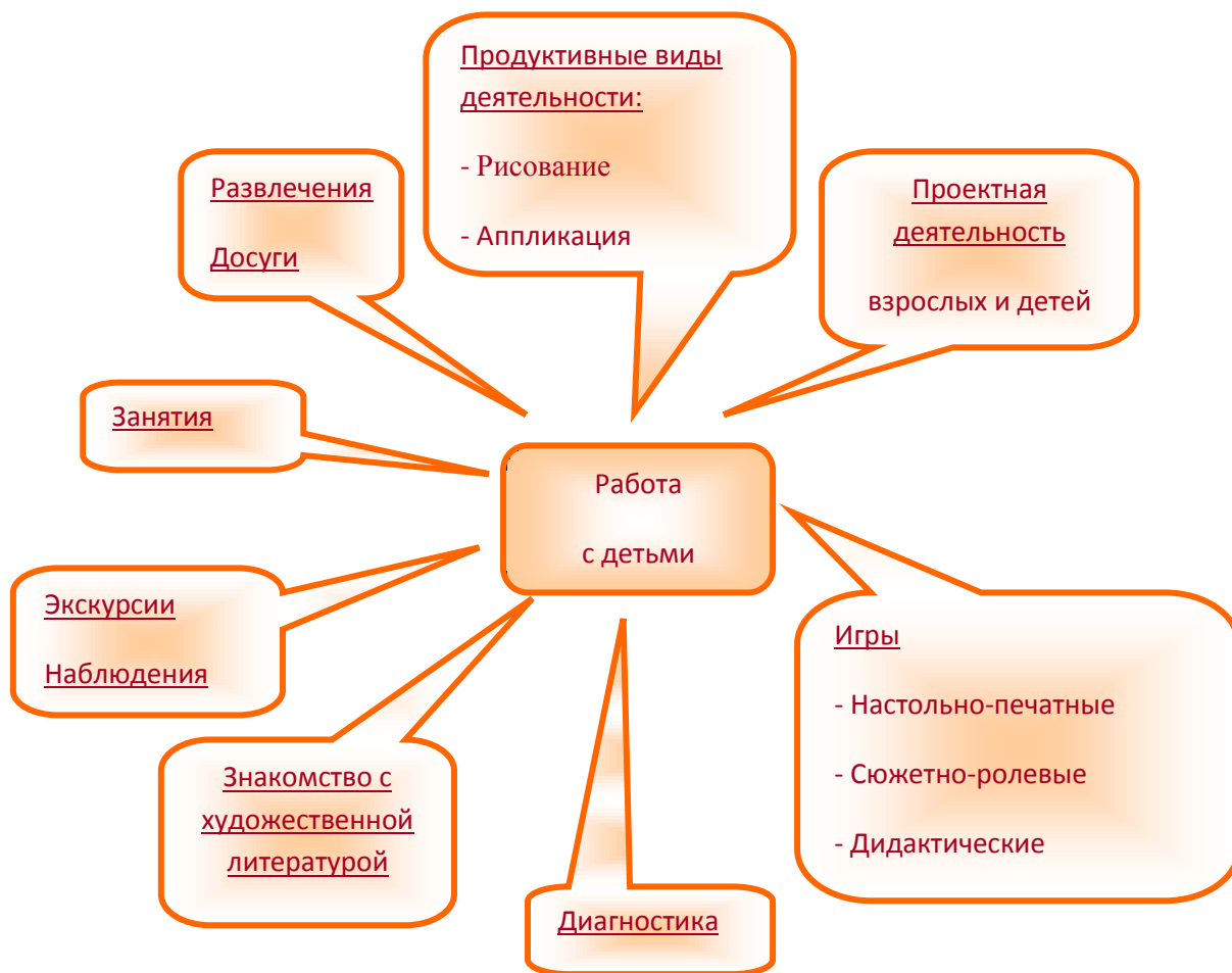
Рис.1 Формы работы с детьми по обучению безопасному поведению на дороге